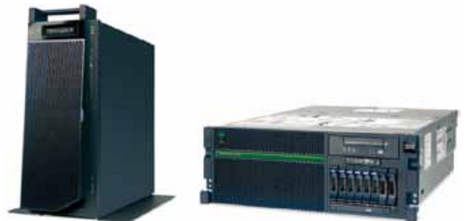
Power 720 Express 타워 및 랙 탑재형 서버

왜 이렇게 많은 고객이 IBM Power Systems™를 선택하고 있는지 알아보십시오. 안정적이고 안전한 Power 720 Express는 최대 8개의 POWER7+™ 코어를 유연하고 4U 랙에 최적화된 폼팩터 또는 타워형 폼 팩터에 지원하는 1소켓 서버입니다. Power 720의 성능, 가용성 및 유연성을 통해 기업들은 AIX, IBM i 및 Linux 운영 체제를 지원하는 수많은 ISV의 입증된 솔루션을 활용하여 비즈니스에 더 집중할 수 있습니다.