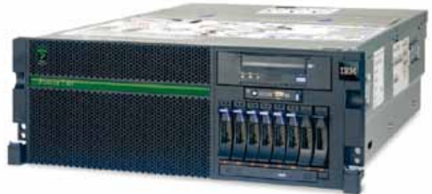
Power 740 Express 랙 탑재형 서버

Power 740 Express는 최대 16개의 POWER7+ 코어를 4U 랙에 최적화된 유연한 폼 팩터에서 지원하는 1소켓 또는 2소켓 서버입니다. Power 740은 대용량 메모리, 탁월한 성능의 POWER7+ 프로세서, PowerVM 및 워크로드 최적화 기능을 제공하므로 고객은 활용도와 성능을 향상시키고 인프라 및 에너지 비용을 절감하여 시스템에서 최대의 이익을 얻을 수 있습니다. 최신 Power 740 Express 모델은 향상된 메모리 용량, 고성능 POWER7+ 프로세서 및 높은 대역폭의 2세대 PCI-Express 슬롯을 추가하여 더욱 향상된 성능을 제공합니다.